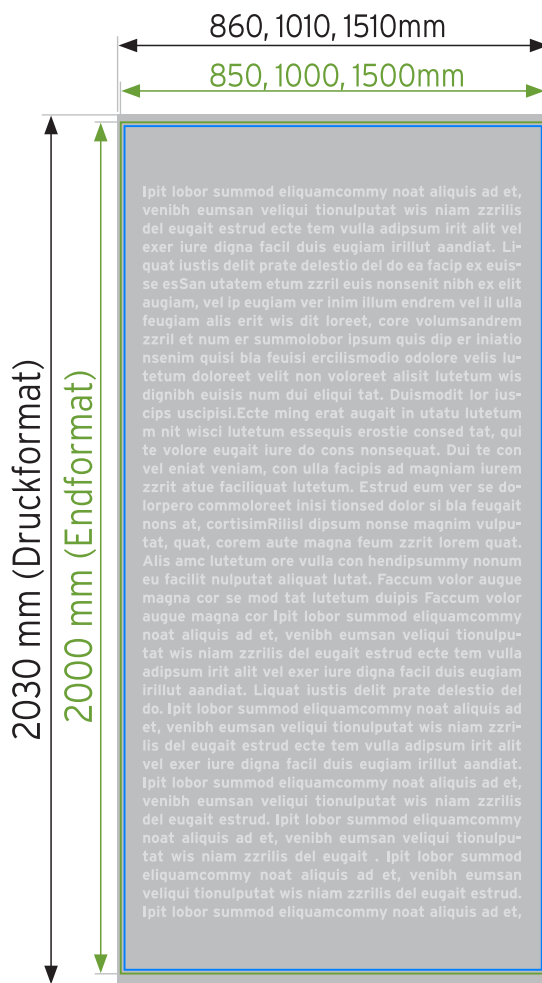
Skizze nicht maßstabsgetreu